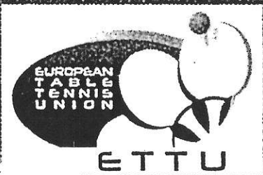
TABLE TENNIS 2015